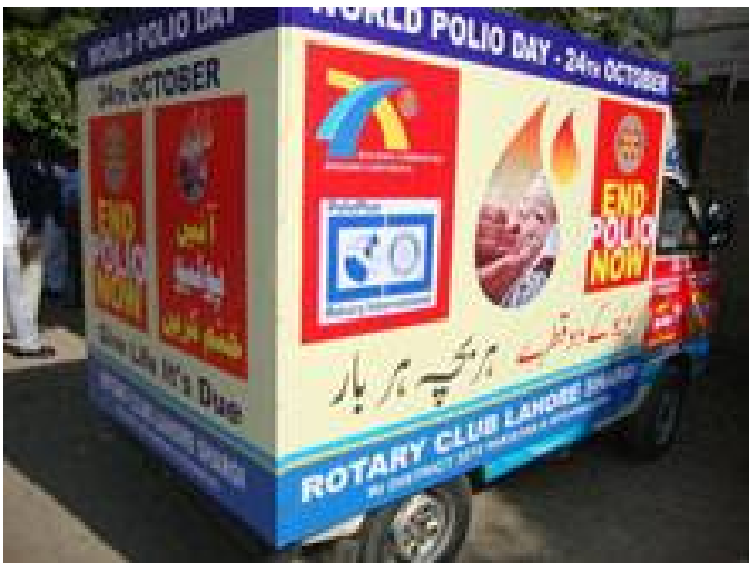
Los rotarios se preparan para correr la voz sobre el Día Mundial de la Lucha contra la Polio el próximo 24 de octubre.

Rotarios de todo el mundo llevarán a cabo eventos de concienciación y recaudación de fondos en conmemoración del 24 de octubre, Día Mundial de la Lucha contra la Polio.