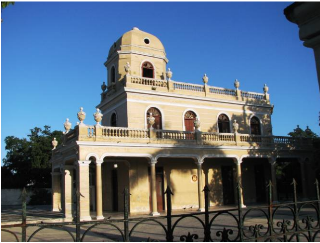
Casa Rotaria de la amistad en Mérida