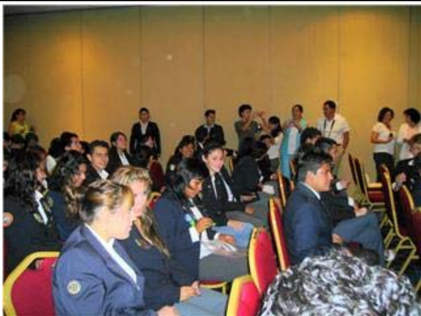
Jóvenes de Intercambio, del distrito 4200 se van 84, de los cuales 15 son de los clubes de tabasco, los padres muy entusiasmados y dispuestos a atender a sus hijos de intercambio.